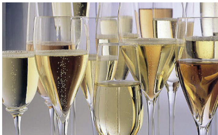
Niewiele białych win może przetrwać dłużej niż kilka lat. Stare białe wina tracą połysk

- Do obserwacji wybierajmy przezroczyste kieliszki z białego szkła: pozwolą one na najbardziej realistyczne określenie koloru wina.