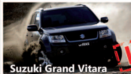
Suzuki Grand Vitara