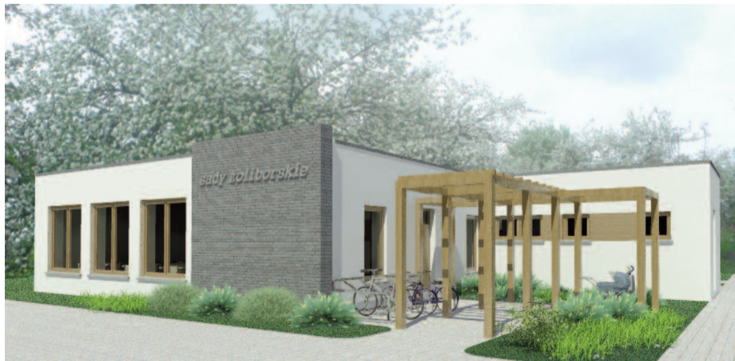
ZAŁOŻENIA PROJEKTOWE – WIZUALIZACJA

części Żoliborza. Kryterium oceny ofert będzie w pierwszej kolejności program, a w drugiej wysokość czynszu i nakładów inwestycyjnych przyszłego dzierżawcy obiektu. Zainteresowani mogą jeszcze do 31 stycznia składać swoje oferty w siedzibie ZGN Żoliborz, przy ul. Marii Kazimiery 1.