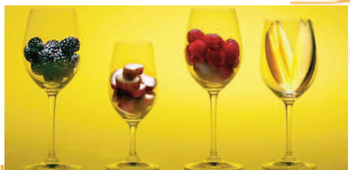
Jeżyna to królestwo dolcetto, syrah i touriga national. Rabarbar możemy odnaleźć np. w pinot noir. Maliny są obecne m.in. w barberze, gamay i lambrusco. Melon i inne owoce tropikalne to domena win białych, chociażby chardonnay.