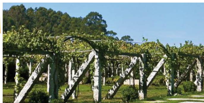
Producenci win z Galicji stosują różne metody produkcji, m.in. systemy pergoli, na których prowadzone są winorośle.

kwasowości i delikatnie perfumowanych, kwiatowych nutach. Ze względu na galicyjskie terroir (liczne opady, atlantycki klimat i żyzne