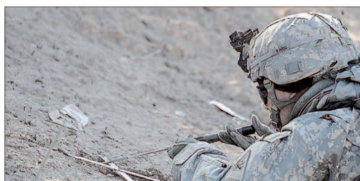
Saper poszukuje min.

Projekt współfinansowany ze środków m.st. Warszawy dzielnicy Żoliborz, realizowany przez Stowarzyszenie „Rezerwat Kultury”.