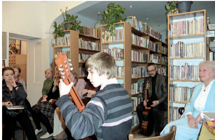
(ukazał się w ubiegłym roku nakładem Miejskiej Biblioteki Publicznej w Pruszkowie) a także obejrzenia wystawki książek księ-