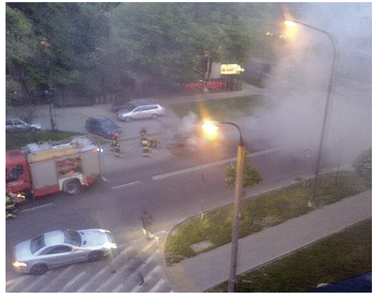
Miejmy nadzieję, że tak będzie nadal, to znaczy, że nikt nie zginie, a regionalny klimat okolic Bieniewickiej i Potockiej nieco złagodnieje. Grabarz

Interwencje Straży Pożarnej są w tym rejonie na prawdę częste i sąsiedztwo strażaków jest nad wyraz zbawienne skuteczne, bo w licznych tutejszych katastrofach nikt do tej pory nie zginął.