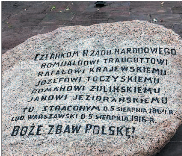
Kamień upamiętniający stracenie przywódców powstania.

„Po strasznej hańbie niewoli, po niepojętych męczarniach uciśku Centralny Narodowy Komitet, obecnie jedyny legalny Rząd Twój Narodowy, wzywa Cię na pole walki już ostatecznej, na pole chwały i zwycięstwa, które Ci da i przez imię Boga na niebie dać przysięga, bo wie, że Ty, który wczoraj byłeś pokutnikiem i mścicielem, jutro musisz być i będziesz bohaterem i olbrzymem!” – głosiła odezwa Rządu Narodowego z 1863 r.