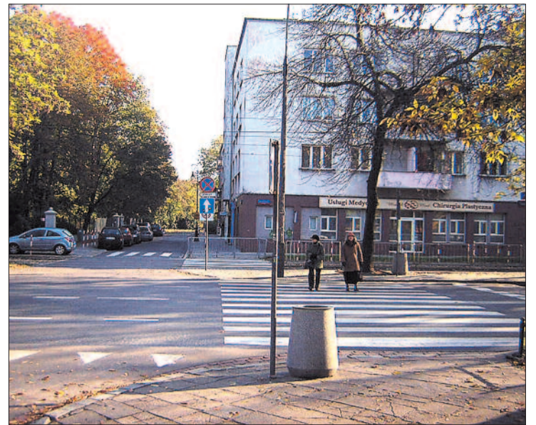
Ulica Ludwika Mierosławskiego – jednego z trzech dyktatorów powstania.

Katalog winien otworzyć Ludwik Mierosławski jeden z trzech dyktatorów powstania, którego ulica biegnie wzdłuż parku Żeromskiego. Swoją drogą, Stefan Żeromski urodził się podczas powstania a jego twórczość w wielu miejscach nawiązuje do tych dramatycznych wydarzeń. Kolejnym patronem żoliborskiej ulicy jest Rafał Krajewski szef Wydziału Spraw Wewnętrznych w Rządzie Narodowym stracony razem z Trauguttem na stokach Cytadeli. Przez powieszenie został stracony również w Cytadeli Jan Jeziorański – minister łączności i komunikacji w Rządzie Narodowym, którego ulica prowadzi do jednej z bram Twierdzy Aleksandrowskiej. Patronem jednej z piękniejszych ulic na Żoliborzu jest generał Józef Hauke, pseudonim „Bosak”, le-