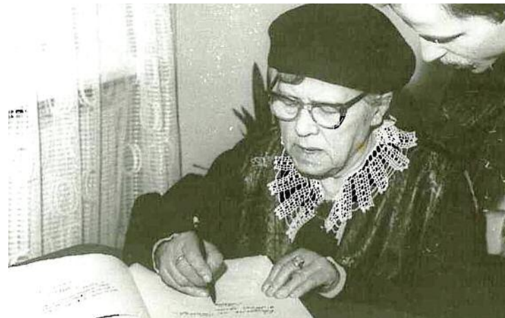
Matka poety i Jej wnukowie wpisują się do Złotej Księgi szkoły

Wiersz „Zegnając się z matką”: „... dalej niebo, dom mój i księżyc opuszczony jak Ty i młodość...” W „Widmach”: „Z dymu będzie dom twój i sen a z płomienia wieczność zupełna” W „Przesłaniu”: „Wywiode noc wiosenną przed zwalony dom”