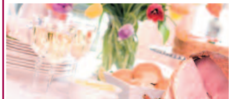
Dobrze dobrane wino może być wspaniałym dopełnieniem wielkanocnego stołu